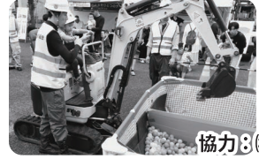
協力 協力3(株)山田組