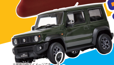
※掲載写真はイメージです。