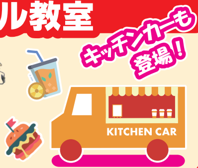
※車種は当日のお楽しみ。